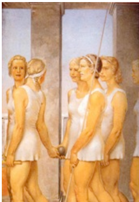
Герхард Кайль. «Физкультурники» и «Физкультурницы».