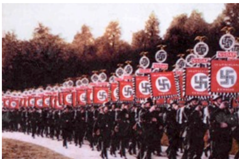
Чёрная форма СС на поле Цепелин. 1933 г.