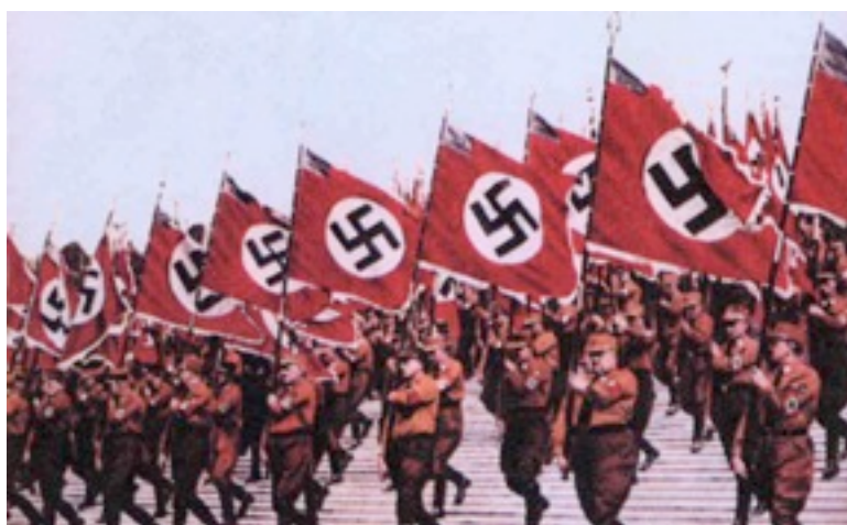
Коричневые рубахи штурмовиков СА на марше в Нюрнберге. 1933 г.

СС – «охранные отряды» НСДАП, превратившиеся в вооружённые элитные формирования нацистской Германии.