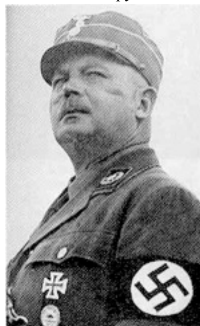
Слева: нацистский плакат «Один народ. Один рейх. Один вождь.» Справа: руководитель СА Эрнст Рём.