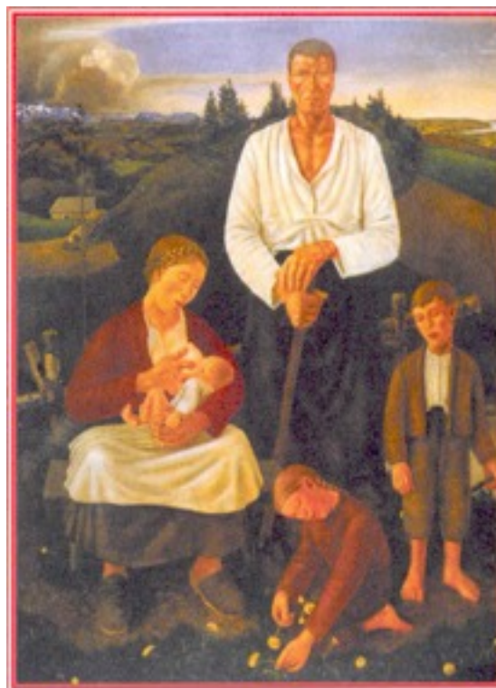
Фриц Фрёлх "Крестьянская семья района Верхней Австрии" 1936-37. Государственный музей Пордиго. Линц.